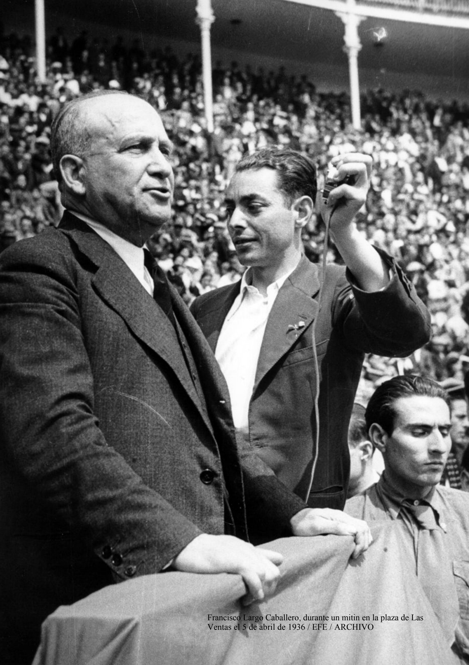
Francisco Largo Caballero, durante un mitin en la plaza de Las Ventas el 5 de abril de 1936