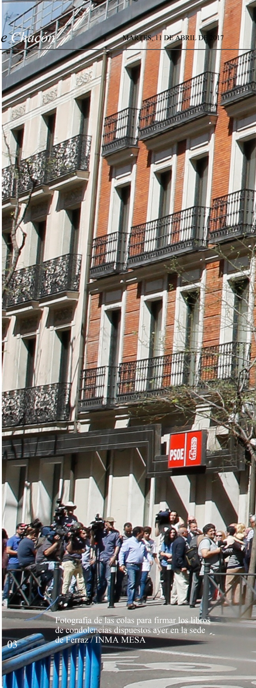
Fotografía de las colas para firmar los libros de condolencias dispuestos ayer en la sede de Ferraz

El alcalde de Vigo y presidente de la FEMP, Abel Caballero, expresó su "tremendo pesar" e "inmenso dolor" por la muerte de