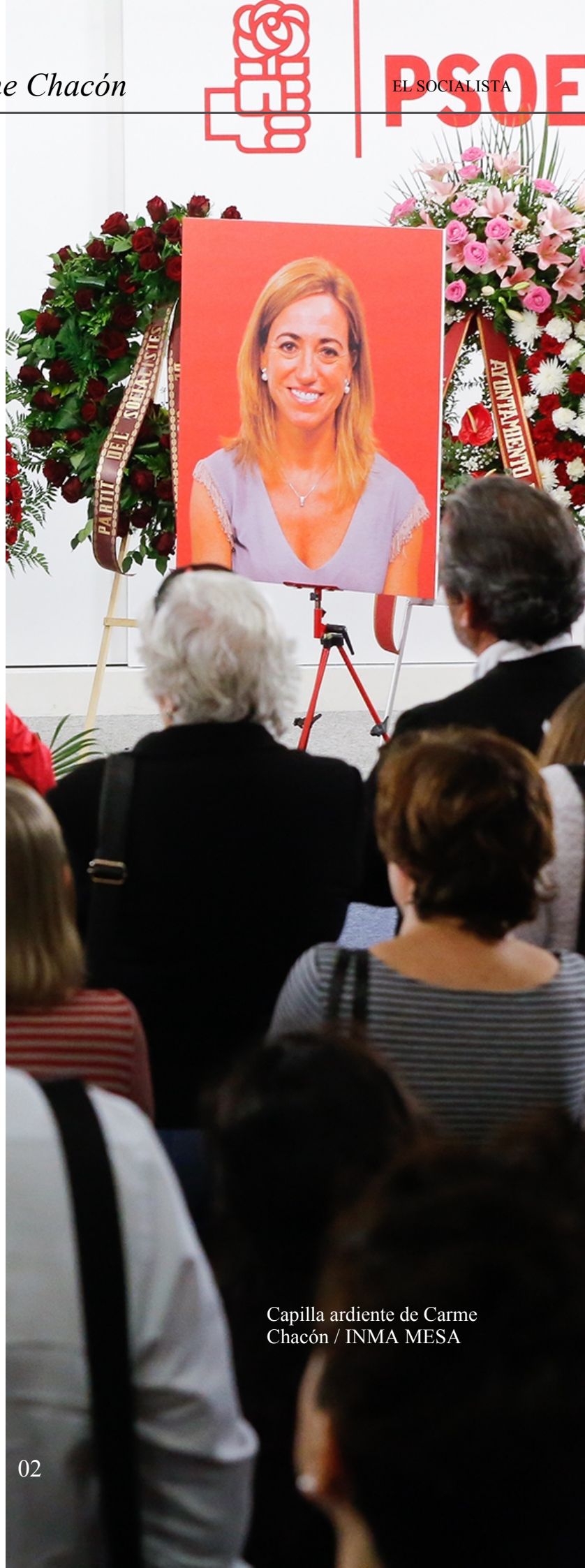
Capilla ardiente de Carme Chacón

El presidente de la Gestora socialista, Javier Fernández, dijo que el recuerdo que tiene de Carme Chacón son dos imágenes de una mujer "valiente y con coraje", una pasando revista a las tropas cuando estaba embarazada y otra del momento en que defendió su candidatura a la Secretaría General.